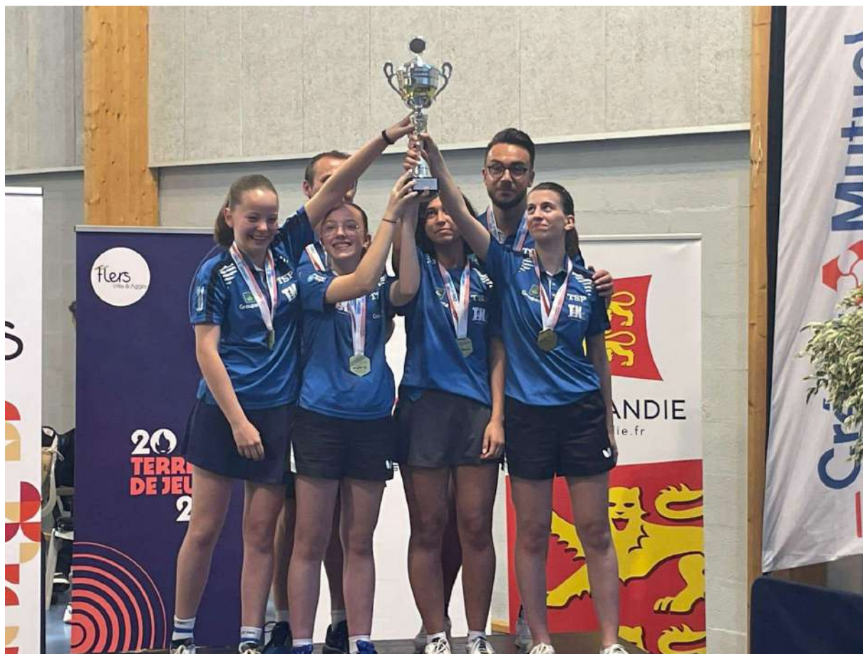
Equipe 2 de TT Bourgoin Jallieu Championnes de France de Nationale 3 dames